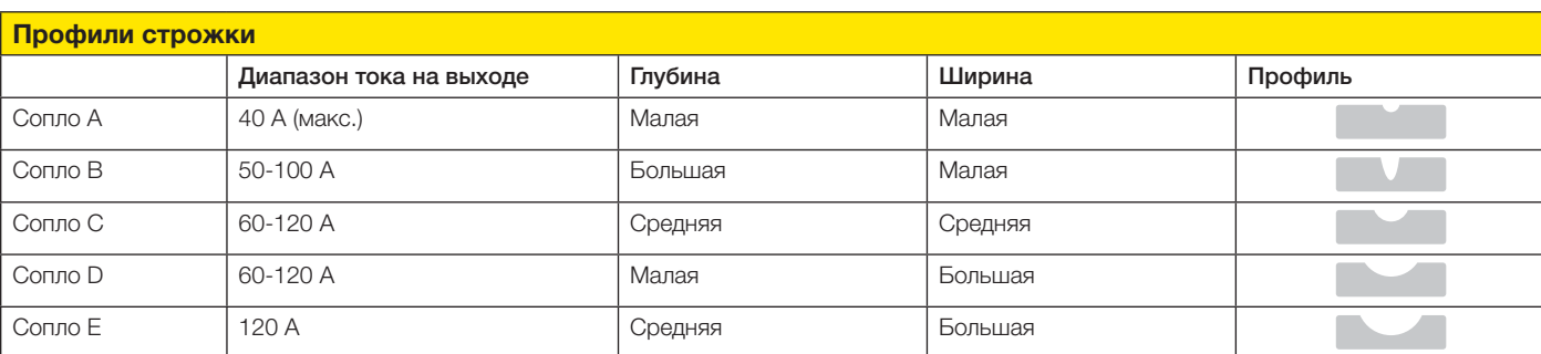
Таблица профилей строжки для выбора надлежащего сопла, наиболее подходящего для вашей области применения